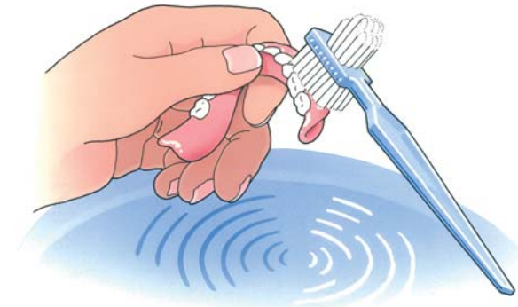
Reinig uw kunstgebit na iedere maaltijd

Uw kunstgebit is nu nog nieuw en mooi. Dat wilt u natuurlijk graag zo houden. Daarom moet u, net als bij eigen tanden en kiezen, uw kunstgebit verzorgen. Als u het niet regelmatig schoonmaakt, blijven er voedselresten achter. Zowel op uw kunstgebit als eronder. Als u die niet verwijdert, kan uw tandvlees op den duur gaan ontsteken. Reinig uw gebit daarom zorgvuldig na iedere maaltijd. Gebruik een speciale protheseborstel, bijvoorbeeld van Lactona of Oral-B, en water om etenresten goed te verwijderen. Gebruik géén tandpasta. Die kan te veel schuren. Een schoon kunstgebit voelt altijd glad aan. Laat uw gladde gebit tijdens het reinigen niet uit uw handen glippen. Het zal kapot gaan. Vul voor de zekerheid eerst de wasbak met water en reinig uw gebit daarboven.