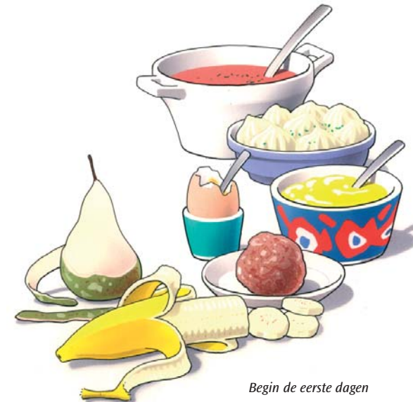
Begin de eerste dagen met zacht voedsel

Eten met uw nieuwe kunstgebit is wat onwennig. Zeker in het begin zult u voorzichtig aan doen. U ervaart zelf het beste wat wel en niet kan. Neem de eerste dagen zacht voedsel, zoals puree, gehakt en zacht fruit. Probeer enkele dagen daarna een stukje vis en een aardappel. Weer later kunt u voedsel eten zoals vlees of een appel. Stukken afbijten kunt u met een kunstgebit beter niet doen. Snijd uw voedsel daarom in stukjes en kauw rustig en gelijkmatig met uw nieuwe kunstkiezen. Neem daarbij aan beide zijden een stukje voedsel in de mond. Neem er iets meer tijd voor dan dat u gewend was.