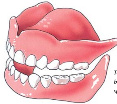
Tanden en kiezen zijn belangrijk voor het kauwen, spreken en het uiterlijk

Als u in de spiegel kijkt, moet u waarschijnlijk erg wennen. Uw mond is nu een maal een belangrijke blikvanger en die is veranderd. Neem een paar dagen de tijd om te wennen en beoordeel pas dan hoe u er met uw nieuwe tanden en kiezen uitziet.